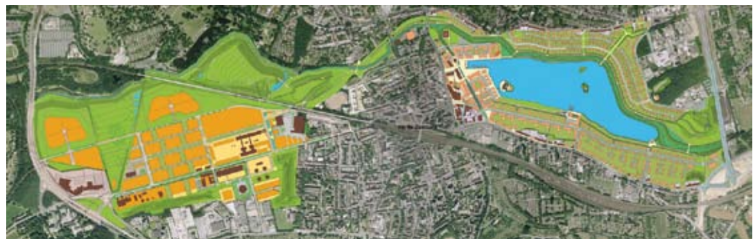
Entwurf: stegemann Architektur und Stadtplanung / Stadt Dortmund