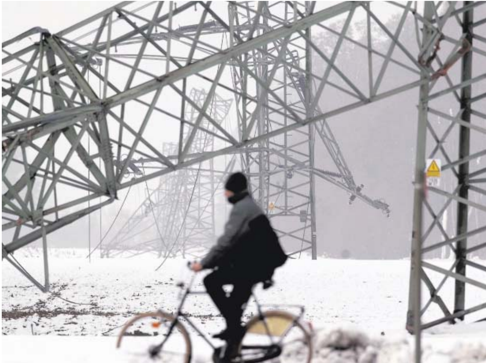
Abgeknickte Strommasten gehörten vor zwei Jahren zum normalen Bild im Münsterland.

Kreisverwaltung probt am grünen Tisch den Ernstfall: Heftigen Regen- und Schneefällen folgt der Stromausfall mit all' seinen Nebenwirkungen in Altenheimen, auf Bauernhöfen . . .